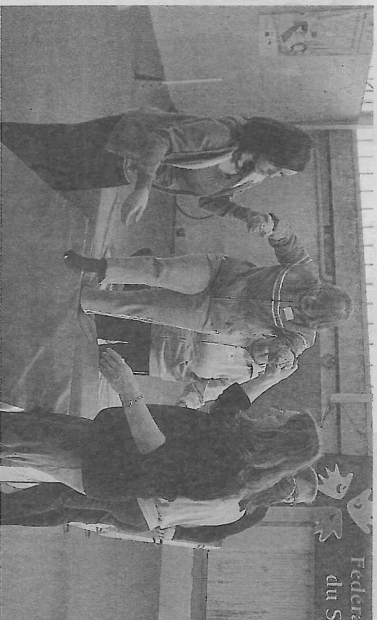
Différents ateliers étaient proposés aux sportifs qui se sont retrouvés, jeudi, dans une salle du club de gymnastique.

« Au cours de cette journée, nous avons pu lire la satisfaction sur les visages des participants. Les sourires étaient nombreux et les stagiaires du Grimes ont été agréablement surpris par les capacités des sportifs handicapés. Les programmes proposés par le PLA étaient parfaits. La salle, pas trop grande, était rassurante pour les sportifs et le matériel convenait à la situation. Ce partenariat relationnel récurrent avec le PLA s'avère déjà très constructif. Nous nous en réjouissons ».