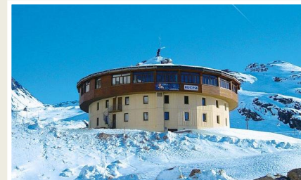
Centre UCPA de Val-Thorens