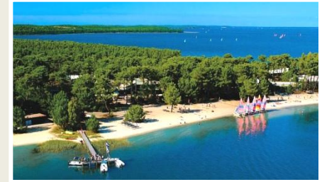
Centre UCPA de Bombannes