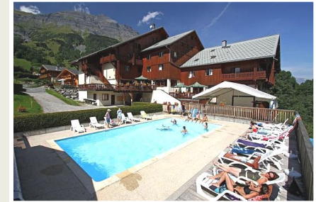
Centre UCPA des Contamines