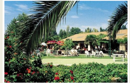
Centre UCPA de Saint-Cyprien